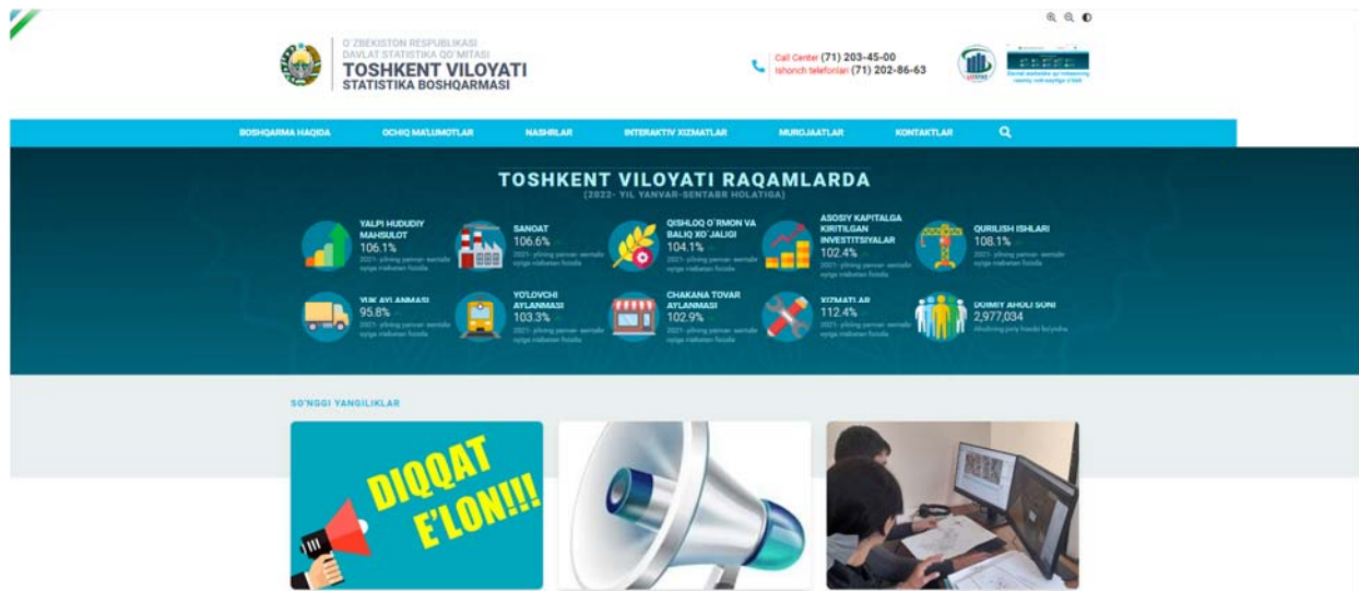
1-rasm. Asosiy sahifa

Asosiy sahifaga kirgandan so'ng foydalanuvchi saytdagi mavjud bo'limlardan o'zini qiziqtirgan barcha ma'lumotlarga kirishi, o'zini qiziqtirgan savollarga javob olishi mumkin