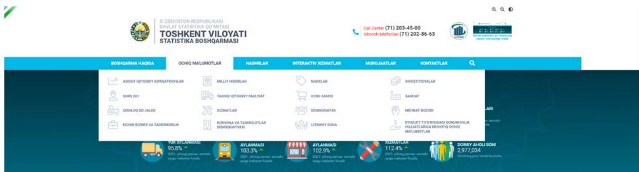
2-rasm.Ochiq ma'lumotlar oynasi