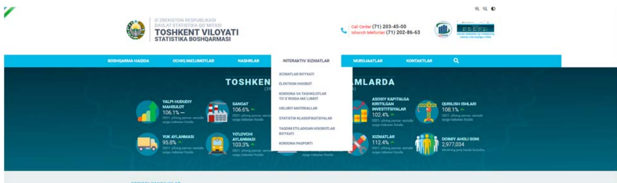
3-rasm.Interaktiv xizmatlar bo'limi

Ushbu bo'limda Statistik hisobotlar topshiradigan tadbirkorlik subyektlariga ma'lumot va yo'riqnomalar mavjud